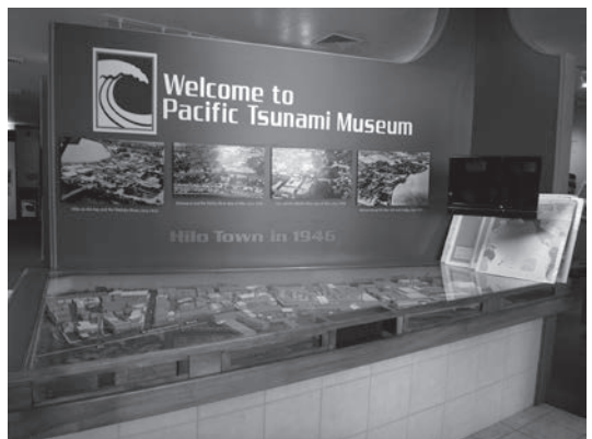
図6：太平洋津波博物館 1946年(津波前)のダウンタウンのジオラマ