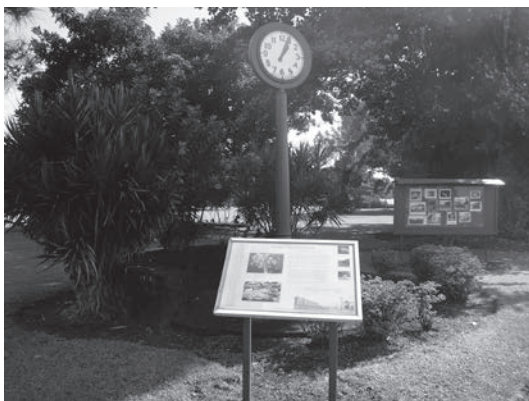
図4 「ワイアケアの時計」