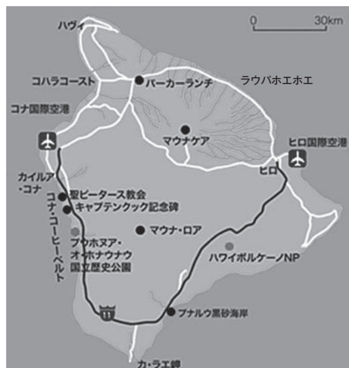
図1 ハワイ島平面図

ヒロでの日本人はダウンタウンの沿岸地区に集住し、2つの町を形成した。「Yashijima(椰