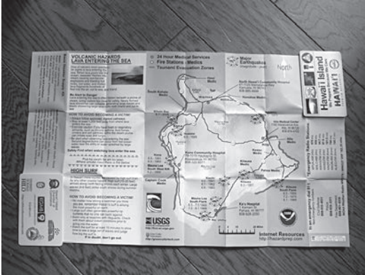
図7 子ども用に配布される防災マップ