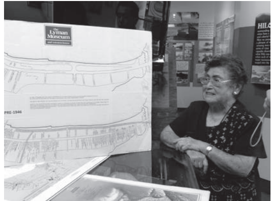
図9 太平洋津波博物館 「語り部」による説明の様子

とくに、平時には景観面での配慮を確保しつつ沿岸地区をレクリエーション空間として利用すること、津波時のリスク回避とを両立している点は、まさに上述の「冗長性」の考え方の実践である。平坦な土地の面積に限られる日本でそのまま参考にするには難しいにしても、災害の履歴を有する場所においては、土地の特性に沿って、平時は冗長性を考慮した観光レクリエーション空間として利用することは、今以上に検討されてよい