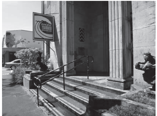
図5：太平洋津波博物館 建物は旧ハワイ銀行本社

ヒロでは、毎月1日の正午にサイレンを鳴らし、試験運用と市民に対する啓発活動を行っている。