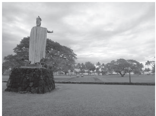
図3 緑地帯からヒロ湾方面を望む かつてShinmachiがあった地域である

このプロジェクトでは、沿岸地区は公共空き地(Open Uses)として盛土をした緑地帯として利用し、安全な場所に限り従来から立地していた商業施設の建築が認められた。現在のヒロ湾沿岸地区は、このプロジェクトで指摘されたような緑地帯、公園やゴルフ場など市民のレクリエーション空間として活用されている(図3)。