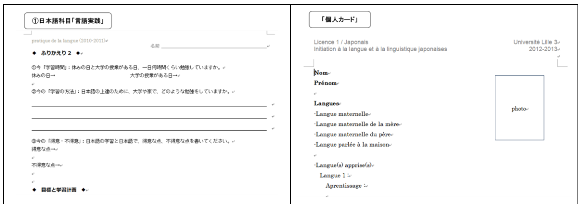
図2 海外の学部生を対象とするポートフォリオ