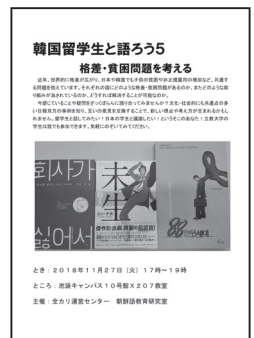
2018年度企画ポスター

朝鮮語では2016年度から「韓国留学生と語ろう」、通称「留学生と語る会」を1年に1、2回、「世界を知ろう！」の企画として行なっている。韓国の留学生と出会う場はいくつかあろうが、何かテーマをもって話す場は意外にないように思われる。そこで、日本人学生の卒論テーマに合わせ、「韓国の学生はどのようにして英語ができるのですか?」「どんなマンガが好きですか?」などをテーマにして話し合った。いちばん最近の2018年11月27日には第5回として「格差・貧困問題を考える」をテーマに、今回は新座の大学院に在籍する韓国人留学生が発題をした。硬いテーマにもかかわらず、活発な議論ができた。毎回参加者は20人前後と多くはないが、朝鮮語を学習する学生も未履修の学生もいて、留学生と話す機会があまりないという学生たちが集まることで意味のある場になっているのではないかと感じる。なお、新座キャンパスでは朝鮮語教育研究室のバックアップで週に1回、韓国人留学生とランチタイムに対話をする会も日常的に行なっている。より日常的で開かれた場を通じて、日韓が一層近くなり、言葉を身に付ける学生が増えるように努力していきたい。