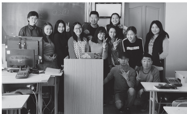
「海外インターンシップ」モンゴル文化教育大 (モンゴル) にて

海外インターンシップでは、現地の教育現場を支えるメンバーの一人として、与えられた役目を果たすことが期待されます。現場に真摯に向き合い、柔軟に対応することで、キャンパスや学生、見える風景が変わります。皆さんが自身の将来について考える、有意義な機会にもなるでしょう。