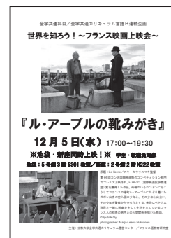
2018 年度企画ポスター

これらは、フランス社会の光と影を浮き彫りにした作品、あるいは人間関係をフランス独特のシニカルなタッチで、ユーモアを交えて映し出した作品です。上映会参加者のみなさんからもこれらの映画の上映を高く評価してもらっています。そのような映画の上映が、フランス語圏の社会をよりよく知り、またフランス語履修者の継続学習の切っ掛けとなるものと考えており、今後も同様に、素晴らしい作品を紹介していく予定です。