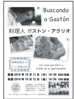
2018年度企画ポスター

残念ながら、純然たる「スペイン映画」を上映した前年より参加学生数はやや絞られたが、池袋では上映後ペルー人留学生に補足をしてもらい活発な質疑のひとときを持てた。また新座では、食文化の講義で紹介された、とスペイン語を履修しない学生も来てくれた。もちろん大歓迎。ベンガクやタイを離れ、生活の場から「ことば」への接近を図れる機会を目指したい。