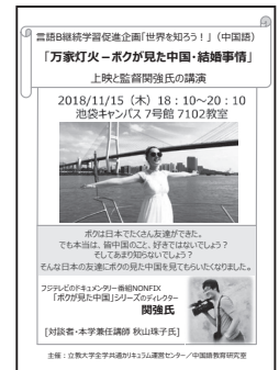
2018年度企画ポスター

初年度の『罪の手ざわり』(原題『天注定』賈樟柯監督・脚本/2013年)は、優れた作品なのだが「恐い国ですね」という感想があり、中国について理解が浅い学生にとってはやや不親切な選択であったと反省、二年目はヒューマンなものとして『唐山大地震』(馮小剛監督・脚本/2010年)を上映した。初年度よりは受け入れやすかったようだが、古い・重いという声もあり、3年目には現在の中国を描いたドキュメンタリー作品「万家灯火ーボクが見た中国・結婚事情」の上映とディレクターの関強氏、本学兼任講師の秋山珠子氏のトークを行った。アンケートから見ると、3年目にしようやく「ねらい」に合った形を作れたようである。