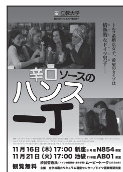
2017 年度企画ポスター

ドイツ語圏の国々の等身大の姿を伝えられるように、今後も素敵な作品を紹介していこうと考えています。