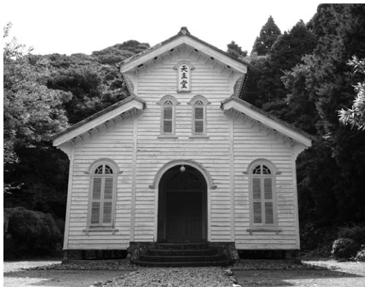
図3 江上天主堂外観(2016年9月17日撮影)

しており、旧江上小学校廃校舎と同グラウンドの脇で樹木に囲まれて建っている。建設されたのは1918年3月であり、2018年に創建100周年を迎えたばかりの教会である。建築に際しては釘が一切不使用であるなど細部に工夫がみられ、また建築家鉄川与助が手がけた長崎で最も完成度の高い木造建築として高く評価されており、2002年には国指定重要文化財に指定されている。