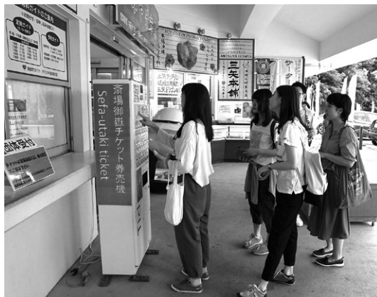
図2 斎場御嶽の券売所 (2016年7月撮影)

次に料金徴収が実際にどう行われているのか、具体的な方法について描写する 1) 。来場者はまず、斎場御嶽の入り口から数百m離れた駐車場に駐車し、物産館と呼ばれる観光協会が運営する土産物販売店の前に設置されたチケットの販売機で必要なチケットを購入することが求められる (図2)。販売機は飲食店などに設置されている機械と類似したもので、現金を投入すると長さ5センチほどの白色のチケットが発行される。数人分をまとめて購入することも可能である。団体など割引チケットを求める場合は、販売機近くにある窓口で観光協会職員から手渡しでチケットを購入する必要がある。