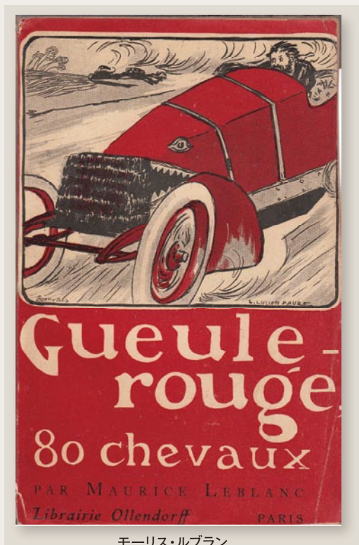
モーリス・ルブラン 『赤い顎、80馬力』