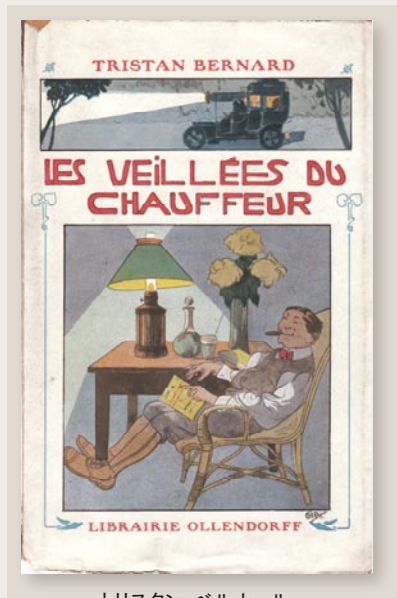
トリスタン・ベルナル 『運転手の夕べ』