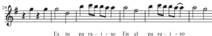
Figura 4. Letras de canción con la melodía

Recapitulando, la canción «Paraíso» del grupo Dvicio tiene abundantes posibilidades de trabajar la fonética y la fonología de forma directa con nuestros estudiantes japoneses. En un primer momento, los estudiantes tienen que escuchar la canción y, después, cantarla siguiendo las instrucciones del profesor o ver el vídeo. De esta manera, las actividades didácticas con esta canción nos darán muy buenos resultados. Lo importante es dar instrucciones claras para que los estudiantes puedan entender y focalizar la atención en la acentuación.