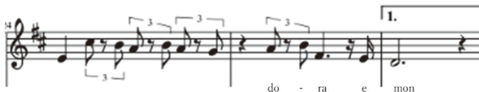
Figura 2. «Doraemon no Uta» versión española 6