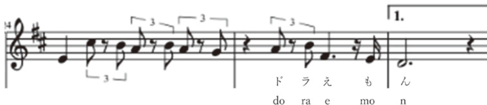
Figura 1. «Doraemon no Uta» versión japonesa 45

Visto lo anterior, aparte de la pronunciación de [u] española, ¿qué se debe enseñar a los japoneses? Históricamente, en el japonés, solo se usaba la estructura de la sílaba (C)V (consonante y vocal). Por haber tomado préstamos del chino y de otras lenguas extranjeras, el japonés actual acepta sílabas cerradas como VC y CVC aunque su número sea muy limitado. En cualquier caso, sin importar si la sílaba es abierta o cerrada en japonés se expresa con una letra japonesa llamada mora (Kubozono, 1998). En las canciones japonesas, una mora suele coincidir con una nota musical mientras que, en español, una sílaba coincide con una nota musical. Por ello, hay diferencia entre sus canciones. A continuación, presentamos algunos ejemplos de la canción de «Doraemon no Uta» para poder reconocer la diferencia de sistemas silábicos de ambas lenguas. La Figura 1 muestra cómo se canta en japonés. La letra «ド (do)» coincide con la nota musical la , la «ラ (ra)» con la si , la «え (e)» con la fa , la «も (mo)» con la mi , la «ん (n)» con la re . La Figura 2 es la versión en español. Conviene que nos demos cuenta de que las diferencias entre la lengua materna y la que se aprende, en este caso la mora en japonés y la sílaba en español, es sumamente importante. Además, con las canciones se pueden poner en evidencia claramente dichas diferencias sin necesidad de mucha teoría, como el profesor Kimura señaló en su presentación en 2018 3 .