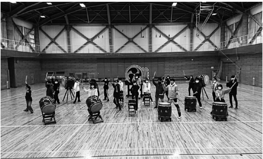
新座体育館にて和太鼓を体験学習している様子

異なるタイプの太鼓を使うことで練習のバリエーションが多くなり、メリハリのある内容で学生がモチベーションを維持し、充実した実践ができたように思う。また、履修者全員が講師の指導の下で同じ内容に取り組む全体練習だけでなく、一人一人が課題を持って自由に和太鼓に挑戦する自主練の時間も設けていた。しかし、和太鼓は、腕を大きく上げるための背筋や体幹を支えるための脚力など、総合的に全身の筋肉を使う運動であるためか、初めの頃は学生に疲労感がみられる場面もあった。それでも授業の後半では休憩時間にまで学生が太鼓を打つ様子がみられ、日本文化としての和太鼓に魅了されて取り組むうちに、自ずと体力も付いていったようである。このような効果がみられる点に、運動文化として和太鼓が注目される理由があるのではないだろうか。