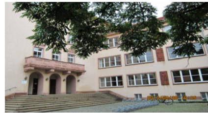
(ライプツィヒ大学ヘルダーインスティトゥート棟)

研修で身につけたことは語りきれません。起きたハプニングの1つ1つが自分の糧になっています。もし願いが叶うとするなら、もう一度また、あの空飛ぶような日々に戻りたいと思うばかりです。