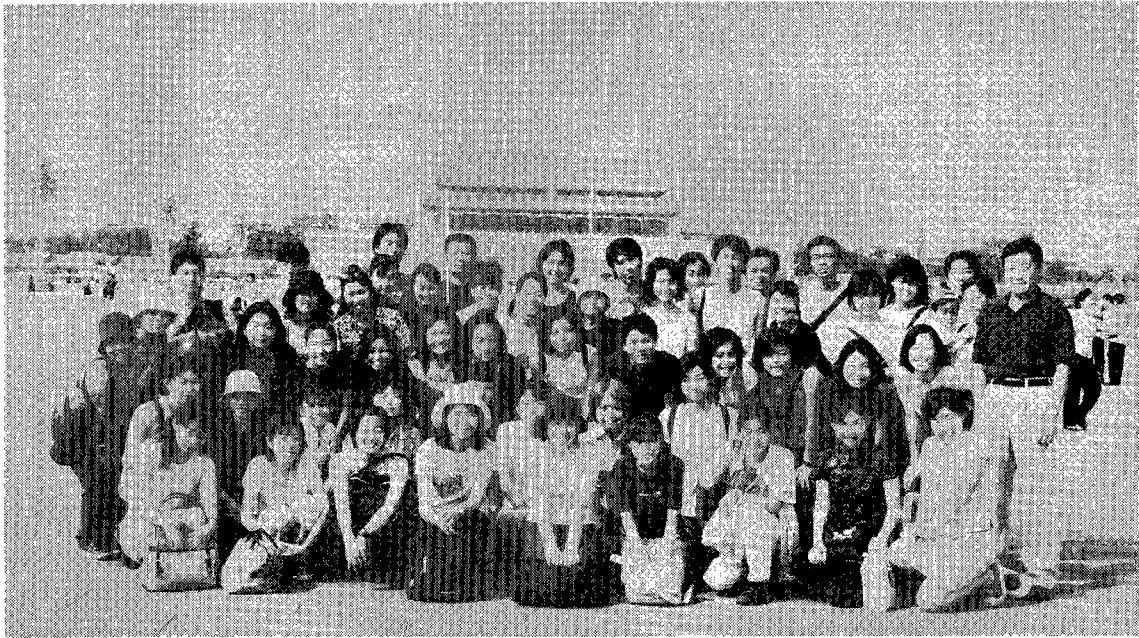
天安門広場での記念撮影。北京では自由行動が主だった。